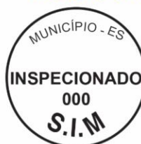
Modelo 3: 4cm de diâmetro